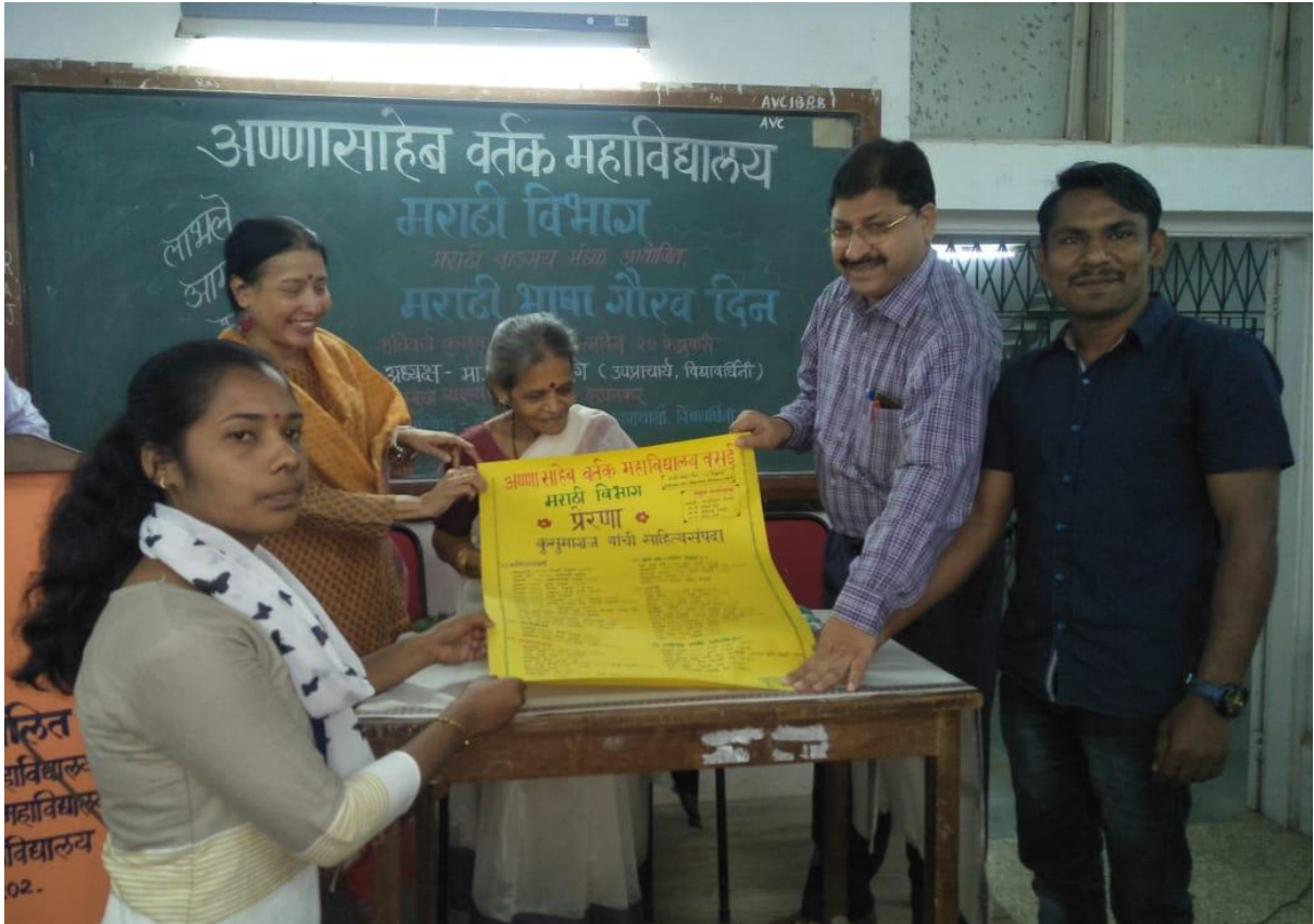
Inauguration of Prerna Wall Paper on the occasion, Marathi Language Day, 27 Feb, 2019